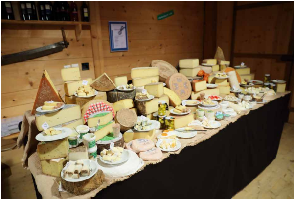
Das Käsebuffet mit x verschiedenen Sorten Käse. Die Auswahl war so riesig, dass man gar nicht recht wusste, wo anfangen...